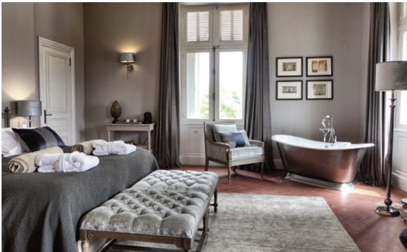
Espace, clarté et élégance dans les chambres de l'hôtel