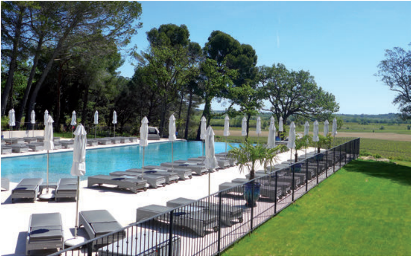
Infinite pool qui fait face aux vignobles, dans le calme le plus complet

Le résultat après la rénovation du Château de Serjac est celui d'une ambition forte, qui porte haut les couleurs des vignobles Bonfils